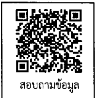
สอบถามข้อมูล