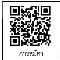
การสมัคร

กองคลัง มหาวิทยาลัยราชภัฏสวนสุนันทา โทร. ๐๙ ๙๙๖๔ ๒๔๕๔