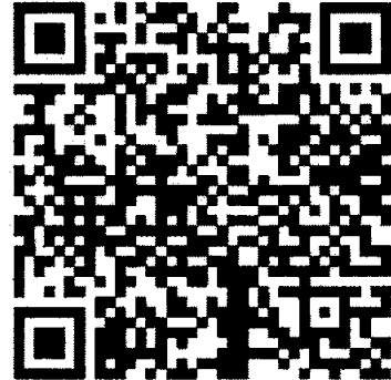
QR code ตรวจสอบรายชื่อ