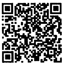
หนังสือโครงการ