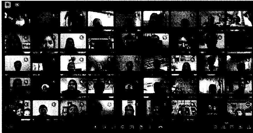
ภาพที่ 1 ผู้เข้าร่วมการอบรมที่ผ่านมาจัดโดยเวิร์คสเปซ ไทยแลนด์

การใช้รูปภาพเป็นไปตามข้อกำหนดตามพระราชบัญญัติคุ้มครองข้อมูลส่วนบุคคล พ.ศ. 2562