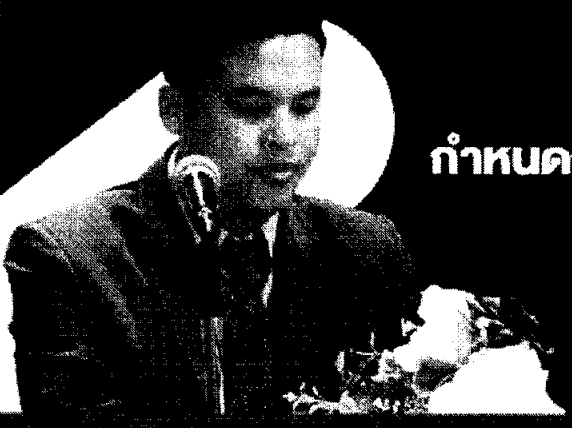
กำหนดการ

ผู้เชี่ยวชาญสมรรถนะทางการบริหาร และวิสัยทัศน์ / ผลงาน