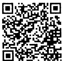
ส่งใบสมัคร