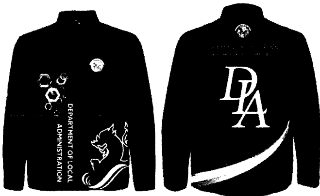
ขอสงวนสิทธิ์ รูปแบบ สวดลาย โทนสี ยี่ห้อ